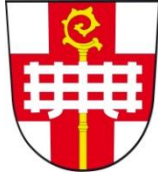
Gemeinde Aura a. d. Saale